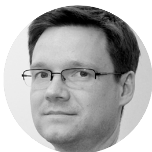
Cleverton Siewert Secretário de Estado da Fazenda

A Secretaria de Estado da Fazenda de Santa Catarina espera que a pesquisa minimize ou elimine distorções na tributação, fortaleça os fabricantes regionais de bebidas frias e incentive a produção e o consumo em território catarinense.